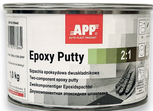
APP № 010440

Обязательное использование шпатлевки с отвердителем