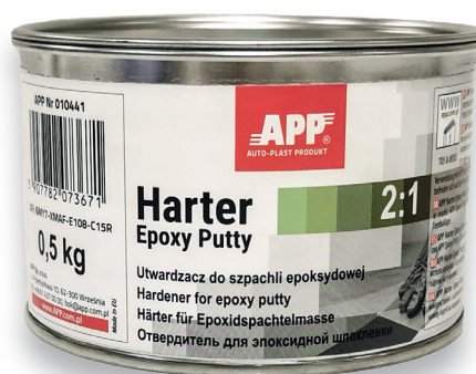
APP № 010441

APP Harter Epoxy Putty 2:1 - Отвердитель для эпоксидной шпатлевки Холодное олово (отвердитель) | 0,5 кг